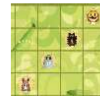
nem, így nem jó

Ezután húzz egy új lapot, hogy megint kettő legyen a kezvedben, majd jön a következő játékos.